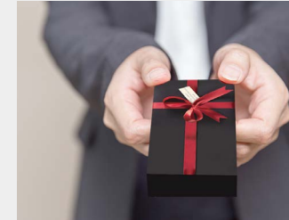
... als Mitarbeitergeschenk