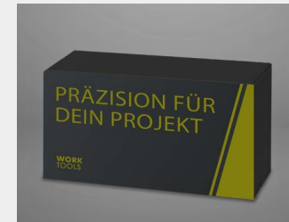
... als Markenbotschafter