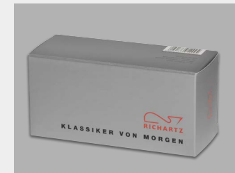
... mit Standardverpackung